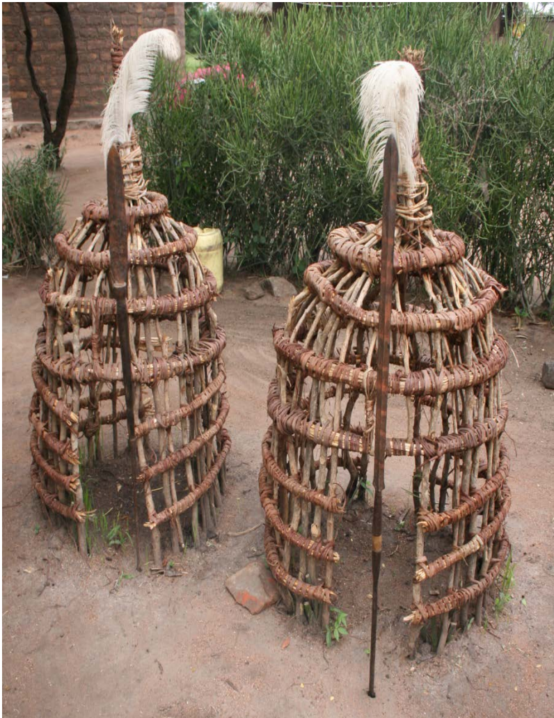
Numba ja masamva – Sukuma forfædrehytter